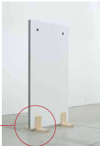
PANALES AUTOPORTANTES IMPRESOS A DOS CARAS (EXPOSICIÓN HISTÓRICA)