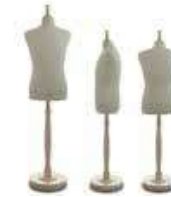
UNIFORMES MILITARES (MANIQUÉS)