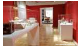
VITRINAS CON PIEZAS (REPRODUCCIONES)