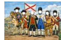
ZONA INFANTIL (PHOTOCALL)