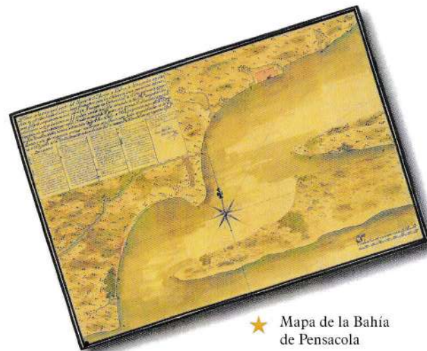
★ Mapa de la Bahía de Pensacola

La Guerra de los Siete Años (1756 - 1763) determinó el endeudamiento de los estados europeos por excesivo gasto militar. Este déficit trató de paliarse mediante subidas generalizadas de impuestos, causando un gran malestar entre sus colonias, particularmente en las inglesas. Estas iniciaron una rebelión que culminaría en su Guerra de Independencia (1775 - 1786) y la creación de los Estados Unidos de América.