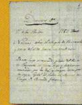
Diario de la batalla de Pensacola, redactado por Bernardo.

Bernardo de Gálvez was a key Spanish military figure in the United States war for independence. As governor of Louisiana, he defeated the British in decisive battles such as Pensacola, cutting off their supplies and relieving pressure on George Washington Army. His bravery earned him the motto "Yo solo" (I alone) and, centuries later, honorary citizenship of the United States. He was also a charismatic Viceroy of New Spain, remembered for his support to the population during starving periods.